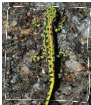
Femelle de Triton marbré

Aujourd'hui, alors que le projet d'aéroport est abandonné, la zone se retrouve de nouveau menacée.