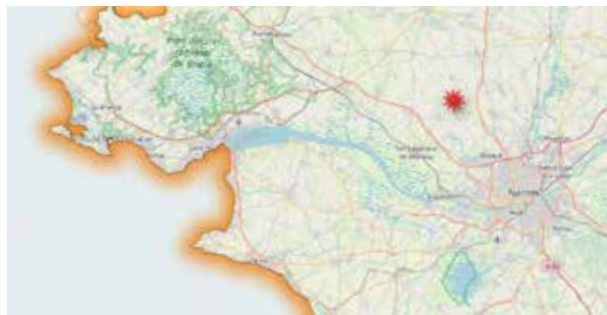
Localisation du projet des "Noues qui poussent" au nord de Nantes

Soutenu par les associations de protection de l'environnement et aidé par les acteurs locaux qui n'ont jamais abandonné ce territoire, le projet des NQP a pour ambition de montrer qu'on peut activement enrayer l'érosion de la biodiversité. Il est ouvert au territoire et bien au-delà, pour partager ses expériences avec toute personne se reconnaissant dans ces objectifs.