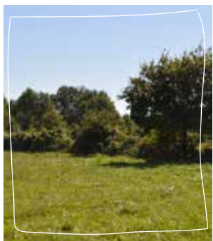
Vu sur le bocage préservé par son histoire spécifique

Pour rappel, la zone dite d' « aménagement différé », devenue « Zone à défendre » (ZAD), a été peu impactée par le remem-brement ; le maillage bocager y est particulièrement dense ainsi que les populations d'espèces protégées qui l'habitent. Certaines zones délaissées ont pu ainsi en quelques années exprimer tout le potentiel écologique qu'elles recèlent.