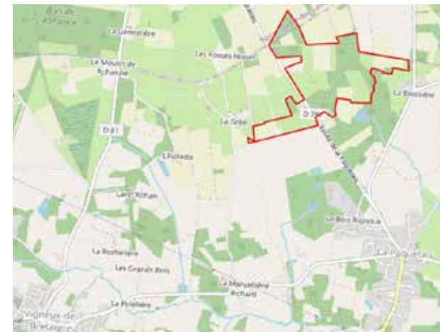
Localisation du projet des "Noues qui poussent"

leur confère un rôle majeur : comme zone tampon dans la rétention et la régulation des eaux de pluie, comme zone d'épuration et dans le développement de la microfaune et des invertébrés aquatiques en participant à l'alimentation des ruisseaux qui les traversent.