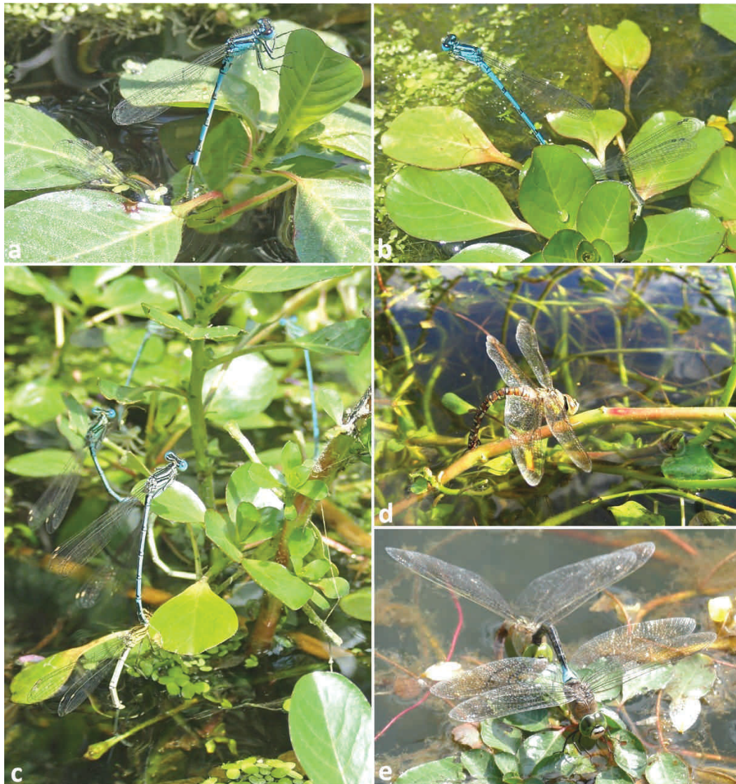
Figure 2. Comportement de ponte d'Odonates dans des jussies : (a) Coenagrion mercuriale , (b) Coenagrion puella et (c) Platynemis pennipes dans Ludwigia peploides ; (d) Aeshna mixta dans Ludwigia sp. ; (e) Anax parthenope dans L. peploides. Odonata laying eggs in the exotic Ludwigia spp.

Mentionnée récemment dans la bibliographie (Tab. 2), l'utilisation de jussies exotiques comme supports de ponte (Fig. 2) constitue la majorité des observations de terrain compilées en France (Tab. 1). En effet, 13 espèces réparties dans les familles des Calopterygidae, Platynemididae, Coenagrionidae et Aeshnidae ont été observées dans neuf départements (Tab. 1). Lors d'un suivi de C. mercuriale sur des contre-canaux du Rhône, LOUBOUTIN et al. (2017) ont pu constater que ce Zygoptère pond fréquemment dans la jussie, parfois seule plante disponible, parfois même en présence d'autres plantes aquatiques favorables.