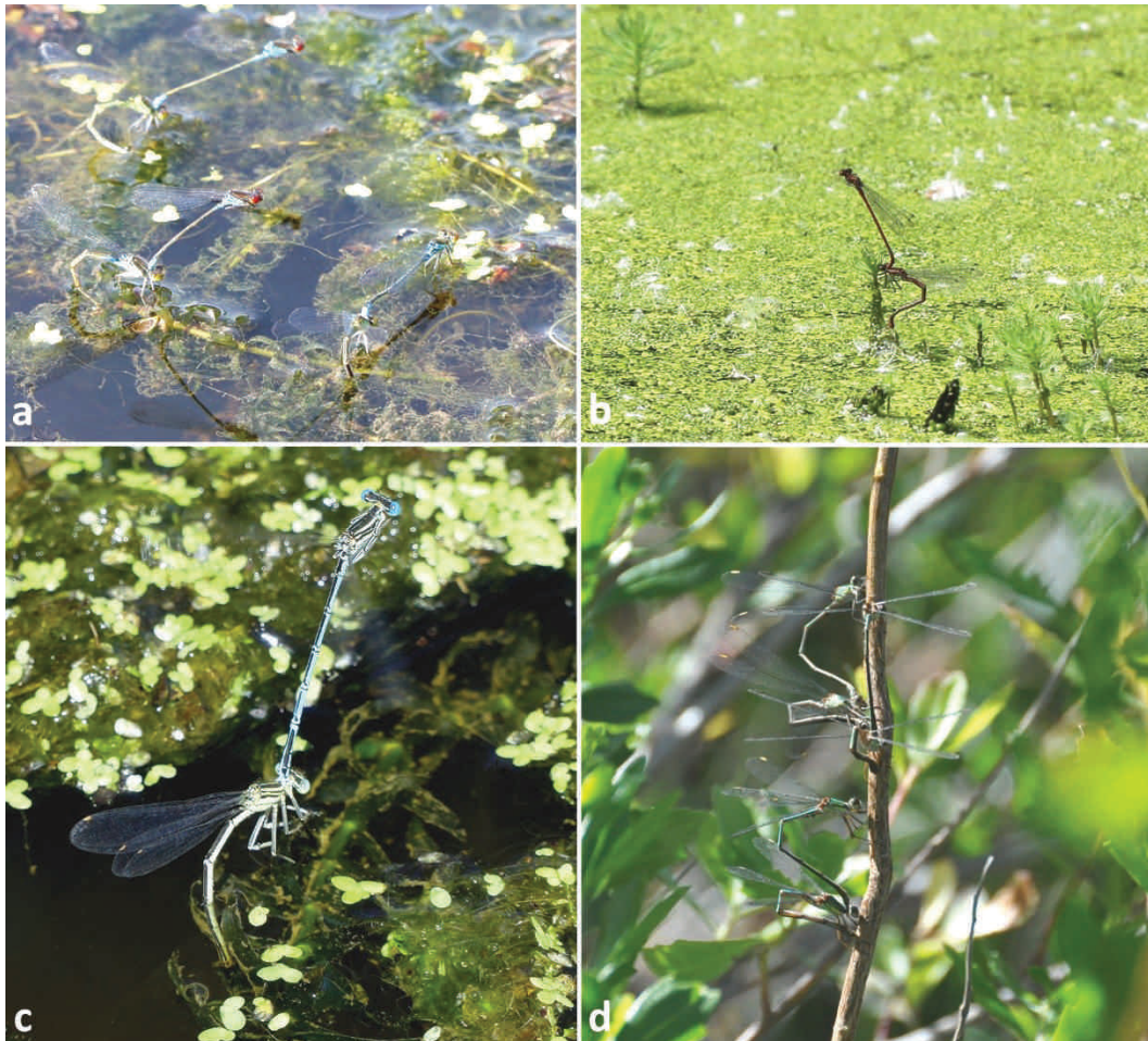
Figure 1. Zygoptères pondant dans des espèces de plantes exotiques : (a) Erythromma viridulum dans Elodea nuttallii ; (b) Pyrrhosoma nymphula dans Myriophyllum aquaticum ; (c) Platynemis pennipes dans Egeria densa ; (d) Chalcolestes viridis dans Baccharis halimifolia. Zygoptera laying eggs in alien plant species .

forestier (Tab. 1). Des adultes émergents de C. puella y ont également été notés, attestant de la reproduction réussie pour cette espèce sur l'étang. Ischnura elegans a été observé à plusieurs reprises en ponte dans cette plante dans une mare ornementale alors qu'il utilise plus classiquement des prêles sur une autre mare proche (G. Riou, com. pers.).